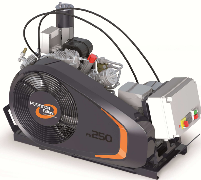
PE250-TE mit Kompressorsteuerung (Sonderausstattung)