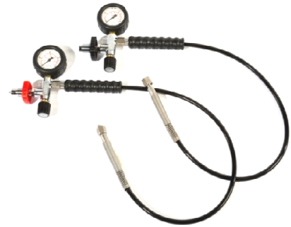
Füllereinrichtung PN200 bzw. PN300