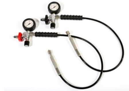
Fülleinrichtung PN200 bzw. PN300